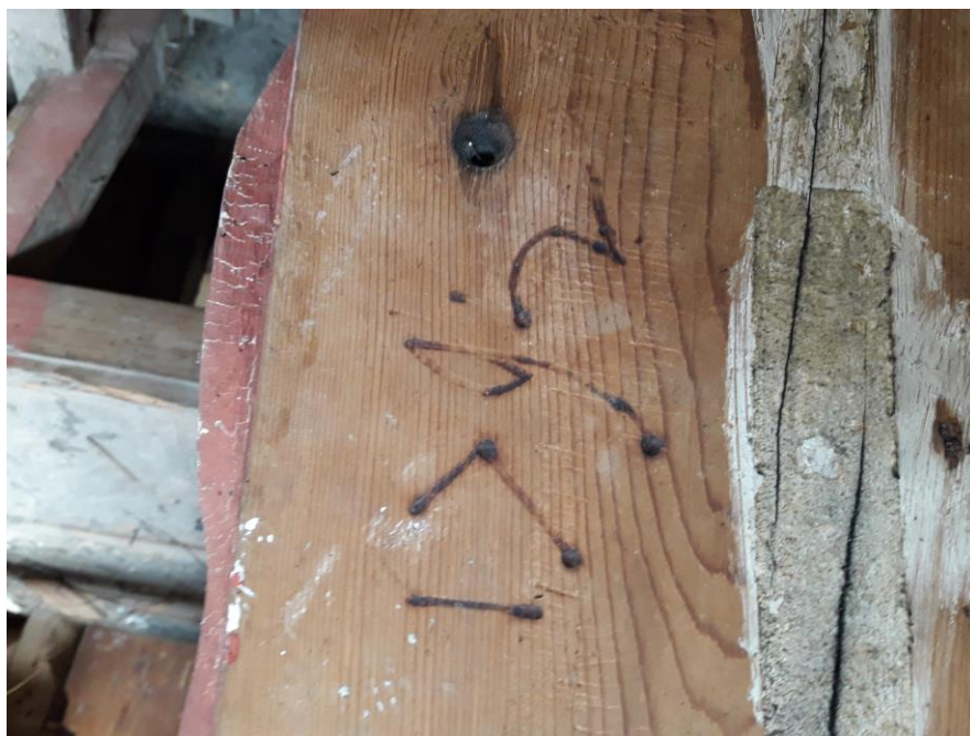
La data 1792 ritrovata sotto il somiere del pedale graffita a fuoco