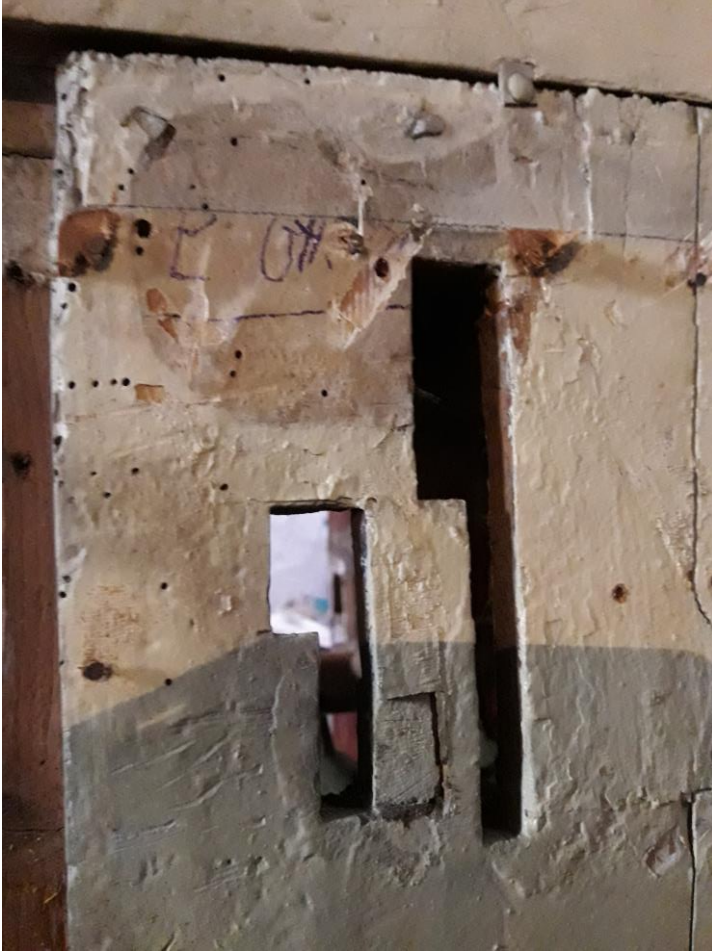
Le fessure dove scorrevano ad incastro le manette per gli effetti speciali