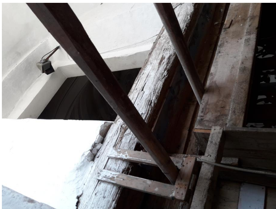
Le leve degli originali mantici a cuneo usate come sostegno dell'attuale mantice