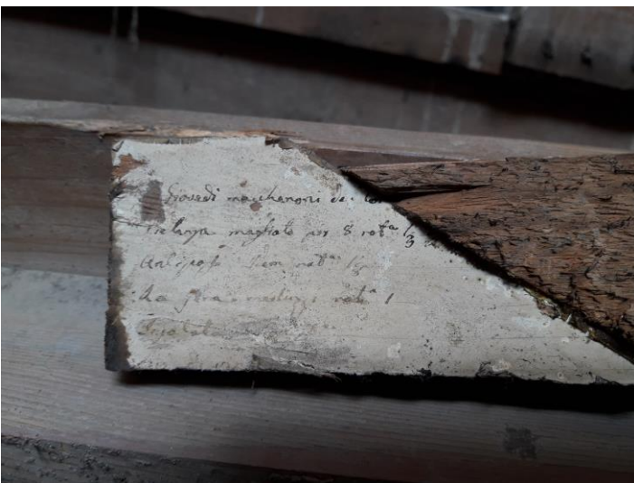
Carta con scritto : Giovedì Maccheroni ecc. ecc